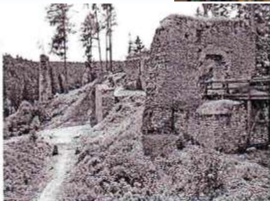
Hrad Pošešín - lokalita středověké kovárny