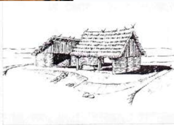
Orientační náčrt středověké kovárny

„Venkovské tradice v krajině II“ - spolupráce celkem pěti MAS - koordinační MAS Sdružení Růže, partnerské MAS KRAJINA SRDCE, „Strážnicko“ Místní akční skupina, MAS Pomalší o.p.s. a NAD ORLICÍ, o.p.s.